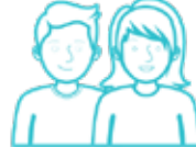
الشباب والرعاية اللاحقة